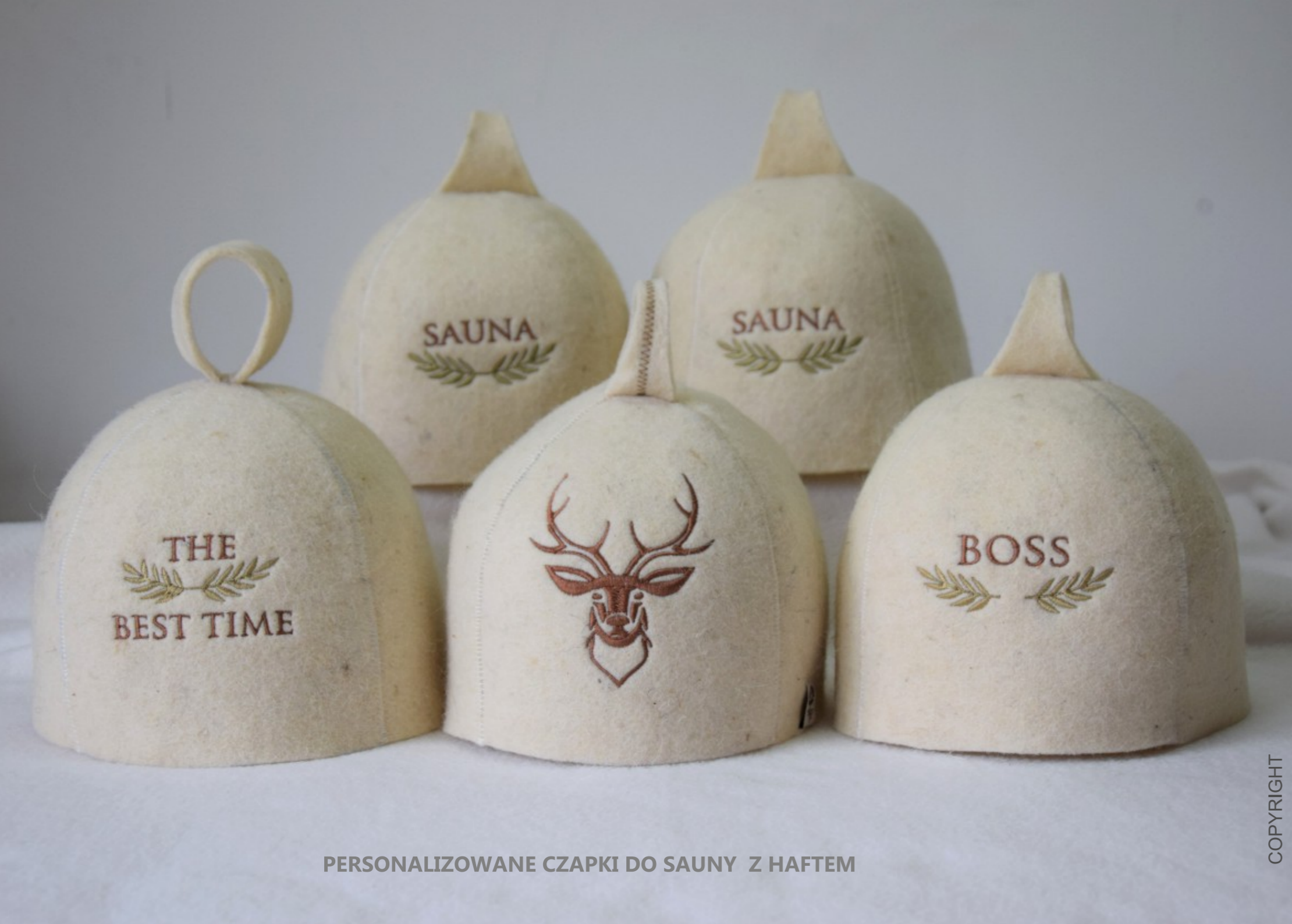
PERSONALIZOWANE CZAPKI DO SAUNY Z HAFTEM

The company was established in 2003 in Poland at the foot of the beautiful Tatra Mountains. Since 2011 the company has been known under the name "ELON". "ELON" means an oak tree with strong roots.