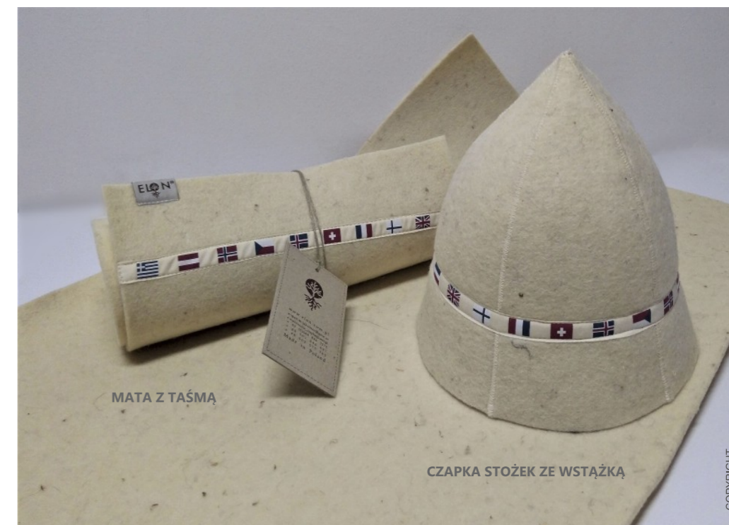
MATA Z TAŚMĄ

Kolekcja która została zaprojektowana do sauny doskonale nadaje się do wspomaganie kuracji w czasie choroby takiej jak przeziębienie czy grypa. Kiedy zażyjemy leki przeciw gorączkowe czapki doskonale chronią nasze ciało przed wyziębieniem oraz pomagają wypocić się skórze.