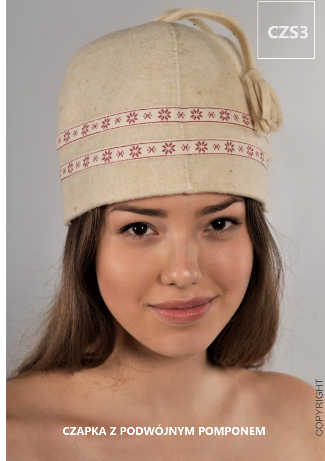
CZAPKA Z PODWÓJNYM POMPONEM